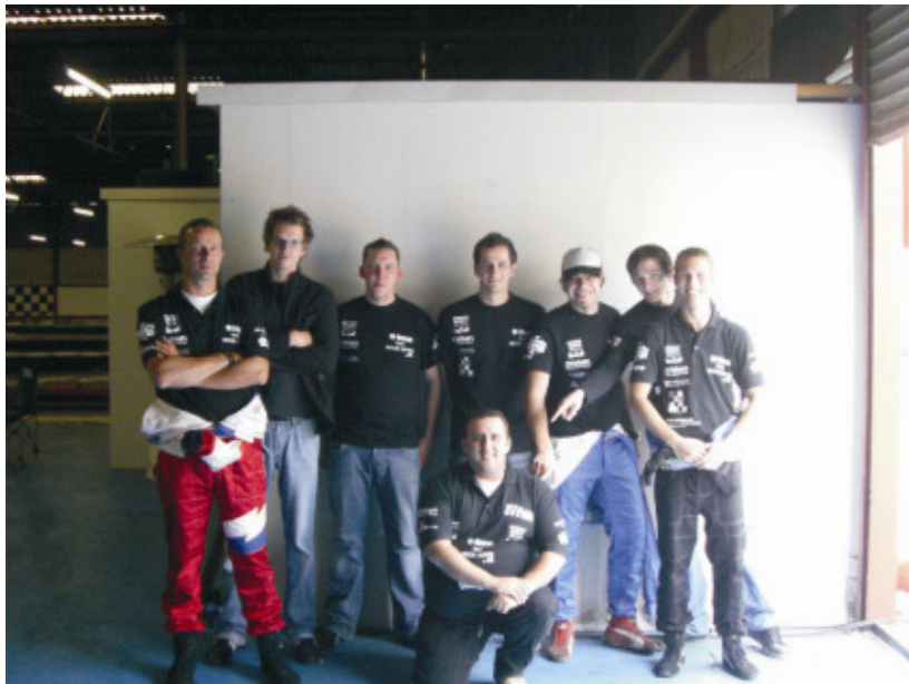
Team 2007 / 2008