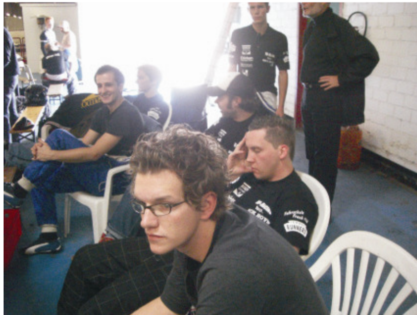
24h Rennen Dinslaken, Sonntagmorgen