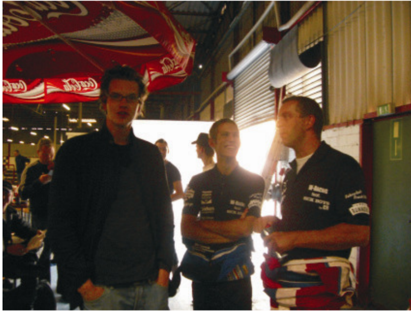
Rennende – Zufriedenheit