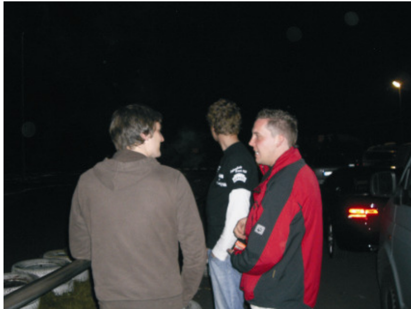
24h Rennen Nachtschicht