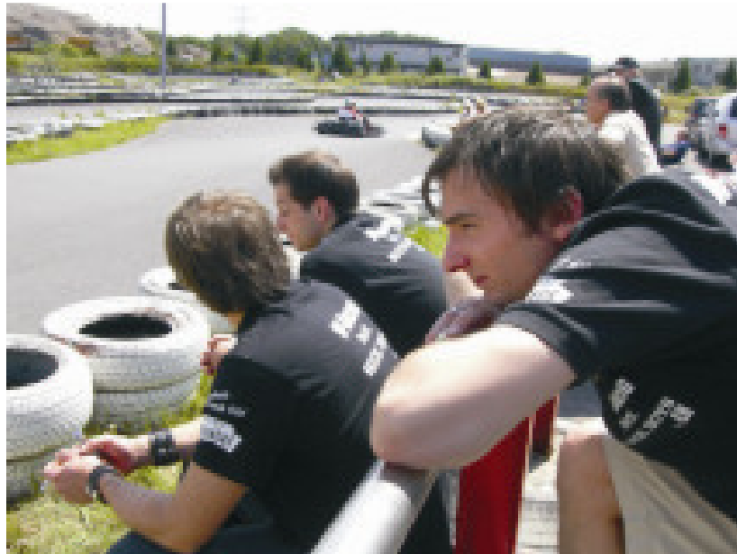
Streckenrand Outdoor Dinslaken